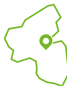
Lage in RLP