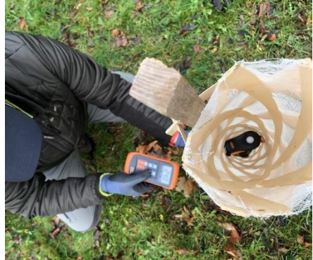
Vitalität bei Kirsche