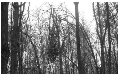
Baum Nr. 19 am 10.05.2005

Anlässlich einer Bereisung im Februar 2008 wurde ein erneuter Handlungsbedarf festgestellt, denn die Kronenexpansion der Ausleseebäume wie