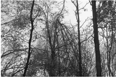
Baum Nr. 13 am 10.05.2005

liche Demonstrationsfläche aufzugeben. Die Schäden seien zu groß, als dass sich die Baumkronen in absehbarer Zeit oder überhaupt regenerieren könnten, Zuwachsverluste seien nicht aufzuholen und überhaupt sei an die Erzeugung wertvollen Holzes nicht mehr zu denken.