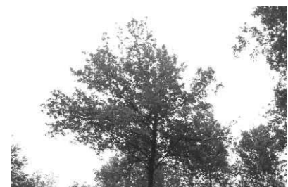
Baum Nr. 7 am 07.11.2008