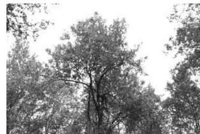
Baum Nr. 19 am 07.11.2008

Interessant ist auch der Durchmesserwachstumsverlauf, der anhand der Messungen in den Jahren 2002 Frühjahr bis 2008 Herbst verfolgt werden kann. Der BHD-Zuwachs der unbeschädigten Ausleseebäume in der Behandlungsfläche veränderte sich durch das Schadereignis kaum. Auch die im Mittel mäßig betroffenen Bäume zeigten einen nur mäßig geringeren BHD-Zuwachs. Die am stärksten betroffenen Ausleseebäume Nr. 12, 13, 14 und 19, die im Frühjahr 2005 mit 80 bis 90% Blattmassenverlust beschrieben wurden, fielen im Mittel der drei auf das Ereignis folgenden Vegetationsperioden im BHD-Zuwachs von jährlich 1,33 cm pro Jahr auf durchschnittlich 0,57 cm pro Jahr ab. In der dann folgenden Vegetationsperiode 2008 lag der Wert bereits