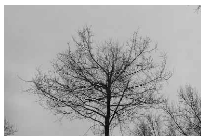
Baum Nr. 7 am 21.04.2008