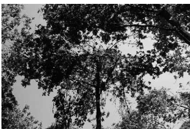
Baum Nr.7 am 01.06.2005

Schnell wurden Meinungen geäußert, diesen Waldortteil als Waldbau-