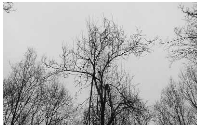
Baum Nr. 19 am 21.04.2008

Es gibt jedoch auch Wermutstropfen, denn durch die bruchbedingt fehlende Assimilationsmasse und das dadurch herbeigeführte Ungleichgewicht zwischen Wurzel und Spross, haben viele der geschädigten Ausleseebäume zusätzlich zur Kronenrege-