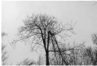
Baum Nr. 13 am 21.04.2008

auch der Bäume in den Zwischenfeldern führte bereits wieder zu intensivem Kronenkontakt. Die Auszeichnung ergab eine Entnahme von 6,3 Bedrängern pro Auslesebaum mit einer Masse von ca. 18 Efm/ha. Die Ausführung erfolgte vor dem Laubaustrieb.