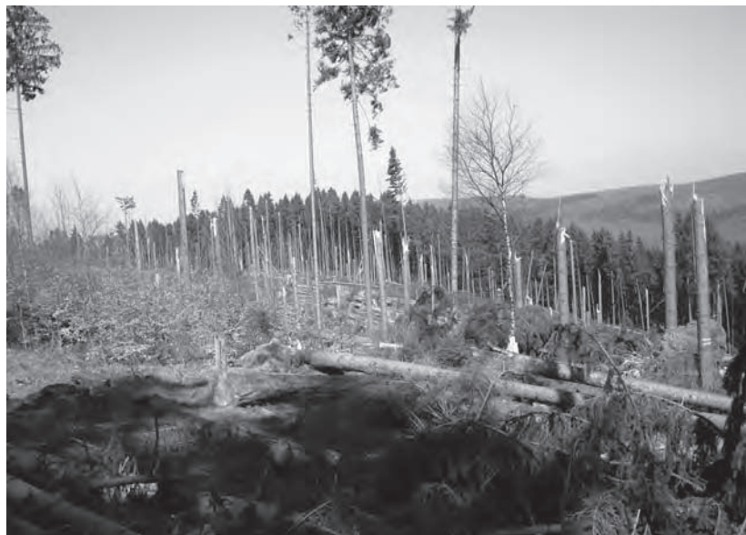
Aufarbeitung und Wiederbewaldung - wie geht es weiter?

Aufarbeitung und Wiederbewaldung von Schadflächen sind eng miteinander verknüpft und erfordern eine frühzeitige und lückenlose Diagnose und Prognose in einem überschaubaren Zeitraum. Schon vor einer notwendigen Beseitigung der Schäden wird die neue Waldgeneration in die