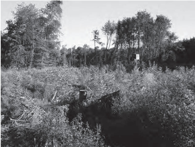
Wie lautet die Prognose - muss gepflanzt werden?

venturarbeiten nur Flächen über einem Hektar einbeziehen, ist eine Etablierungsverpflichtung selbstverständlich auch bei kleineren Einheiten gegeben oder zu prüfen.