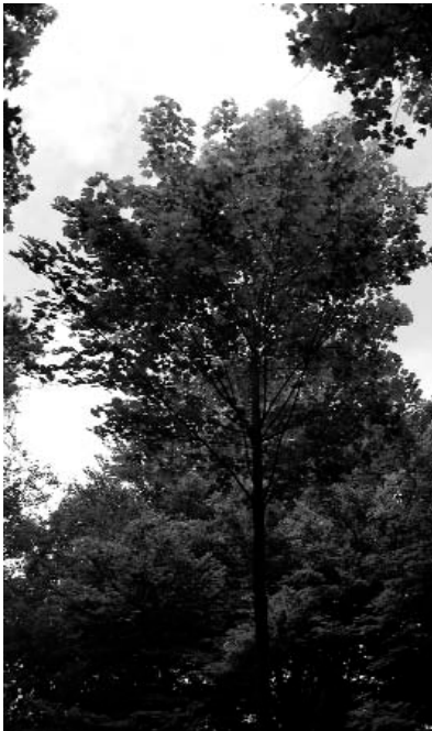
Ergebnis einer Dimensionierungsmaßnahme: Die lichtumfütete Krone

lungen entsprachen. Nachbereitungstermine zur Besprechung der Arbeitsergebnisse fanden in circa 30% der Gesamttermine statt. Hier ist sicherlich noch Spielraum zur Verbesserung vorhanden.