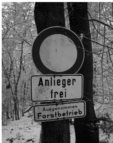
Ohne Worte

Abstieg, Klassenerhalt oder Aufstieg in die nächste Liga?