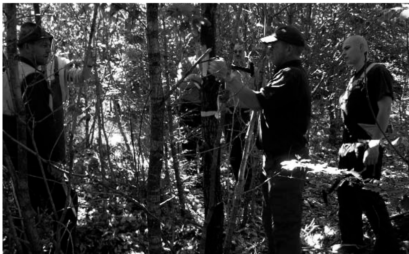
Qualifizierung in der Kleingruppe

Im vergangenen Jahr lief das Waldbautraining eher schleppend an, was überwiegend auf die Störung der Betriebsabläufe durch den Orkan Kyrill zurück geführt werden kann. Zeitlich eingebunden waren die Waldbautrainer durch die Unterstützung der Forstämter bei der Planung der Wiederbewaldung der Windwurfflächen. Der angekündigte Online-Kalender zur vereinfachten Terminbuchung konnte zeitgerecht bereit gestellt werden und wurde rege genutzt. Die Terminbuchung gestaltete sich dadurch im Vergleich zu den Vorjahren wesentlich einfacher, da in der Regel lästige Rückfragen durch sofortige Terminverfügbarkeit vermieden wurden.