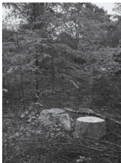
Arbeitsergebnis - ganz wichtig: Nachbearbeitung mit allen Beteiligten

Waldbautraining verzichtet dabei auf die Vorgabe von Schwerpunktthemen. Die Themenauswahl liegt bei den Forstämtern, ganz abgestimmt auf die örtlichen Verhältnisse und konkreten waldbaulichen Herausforderungen. Zur Unterstützung bei der Themenauswahl wird im ForstNet ein Themenkatalog angeboten, der aber nicht abschließend ist. Für neue Vorschläge besteht absolute Offenheit.