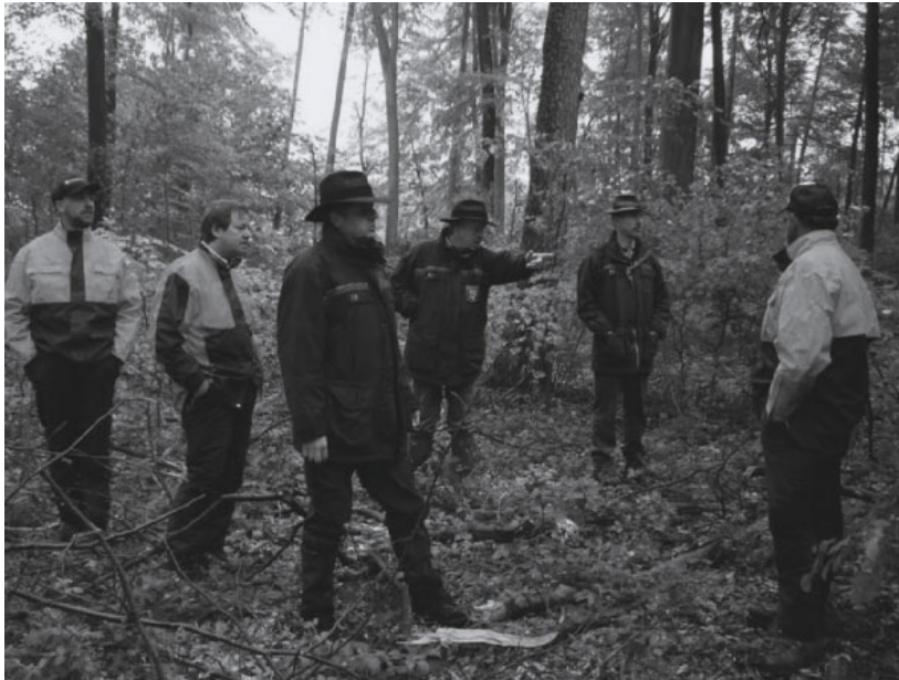
„Training“ durch Vorbesprechung und Planung einer konkreten Maßnahme

diesem Wege in die breite Praxis getragen. Es gilt nun, diese Grundsteine an den verschiedensten Waldbildern ganzheitlich aufzunehmen und mit ihnen „waldbauend“ zu gestalten.