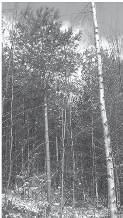
Konsequent freigestellte Kiefernkronen

renzkraft anderer Baumarten auf ganz natürlichem Wege eingeeignet. In jedem Fall aber lässt sich durch gezielte waldbauliche Behandlung mit der Kiefer eine weitaus höhere Wertleistung erreichen als dies unsere heutigen Altkiefern vermuten lassen.