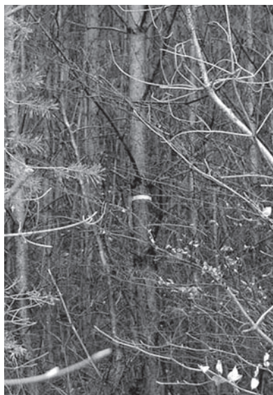
Kiefer vor dem ersten Dimensionierungseingriff

Mit Einstieg in die Dimensionierung gilt es, die Z-Bäume bis zu ihrer größten Kronenbreite zu ästen und konsequent jeglichen Kronenkontakt